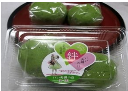
和菓子工房おじま様