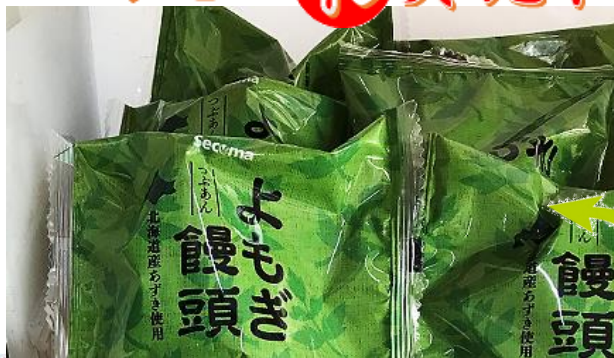
11月22日はいい夫婦の日 よもぎを贈って家族を結ぼう。